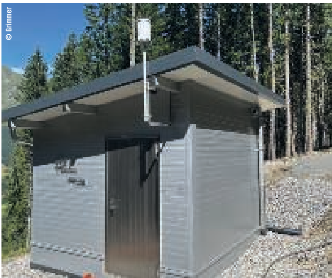
Die Einhausung des Maschinenhauses wurde mit Fertigteil-Edelstahlpaneelen erstellt.

Im Regelbetrieb wird das Wasser der Kramquelle nun in die Einlaufkammer und weiter in das Wasserschloss von Stufe 1 geleitet, wobei es im Bedarfsfall über eine Bodenklappe ausgeleitet werden kann. Die Ab- und Überläufe werden wie bisher über eine Froschkloppendichtung in den Vorfluter – sprich: den Gaisbach – eingeleitet.