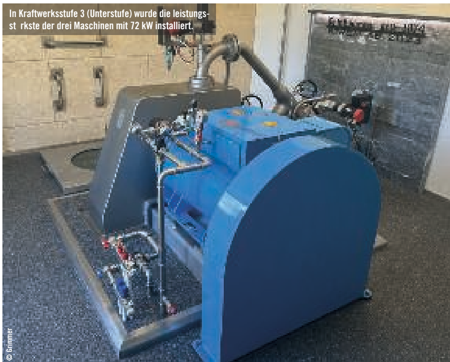
In Kraftwerksstufe 3 (Unterstufe) wurde die leistungsstärkste der drei Maschinen mit 72 kW installiert.

tes Gespann für die Umsetzung des hydroelektrischen Teils des Projekts gewonnen werden.