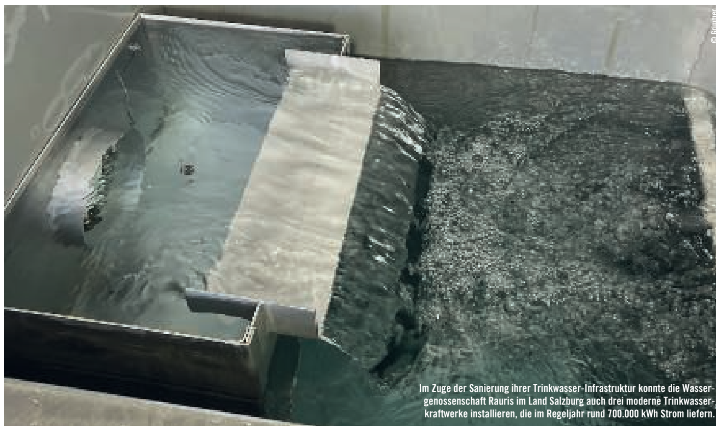
Im Zuge der Sanierung ihrer Trinkwasser-Infrastruktur konnte die Wassergenossenschaft Rauris im Land Salzburg auch drei moderne Trinkwasserkraftwerke installieren, die im Regeljahr rund 700.000 kWh Strom liefern.